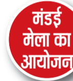
मंडई मेला का आयोजन

आयोजकों ने बताया कि इस 10 दिवसीय आयोजन में आने वाले दिनों में कई कार्यक्रम आयोजित किए जाएंगे। इनमें सबसे बड़ा आकर्षण छत्तीसगढ़ फिल्म अवॉर्ड समारोह रहेगा, जिसमें राज्य की फिल्म एवं कला प्रतिभाओं को सम्मानित किया जाएगा।