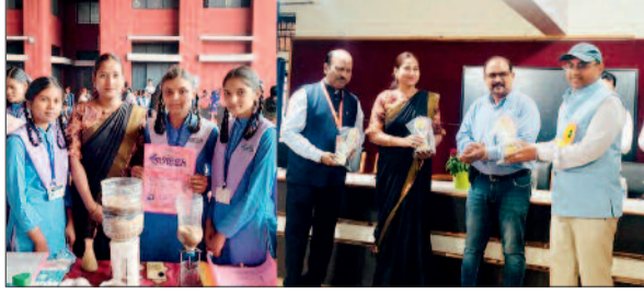
हरिभूमि न्यूज ►►धमधा

शासकीय उच्चतर माध्यमिक विद्यालय चीचा ब्लॉक धमधा को सर्वश्रेष्ठ विज्ञान मॉडल का पुरस्कार प्रदान किया गया। छत्तीसगढ़ विज्ञान एवं प्रौद्योगिकी परिषद रायपुर द्वारा राष्ट्रीय विज्ञान दिवस प्रतियोगिता का आयोजन श्री शंकराचार्य विद्यालय हुडको भिलाई नगर जिला दुर्ग में 28 जनवरी को किया गया जिसमें दुर्ग जिले के सभी विद्यालयों ने विज्ञान, गणित एवं कला विषयों से संबंधित मॉडल की प्रदर्शनी की जिसके मुख्य निर्णायक आईआईटी पटना एवं