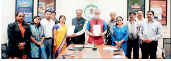
हरिभूमि न्यूज ►►पाटन