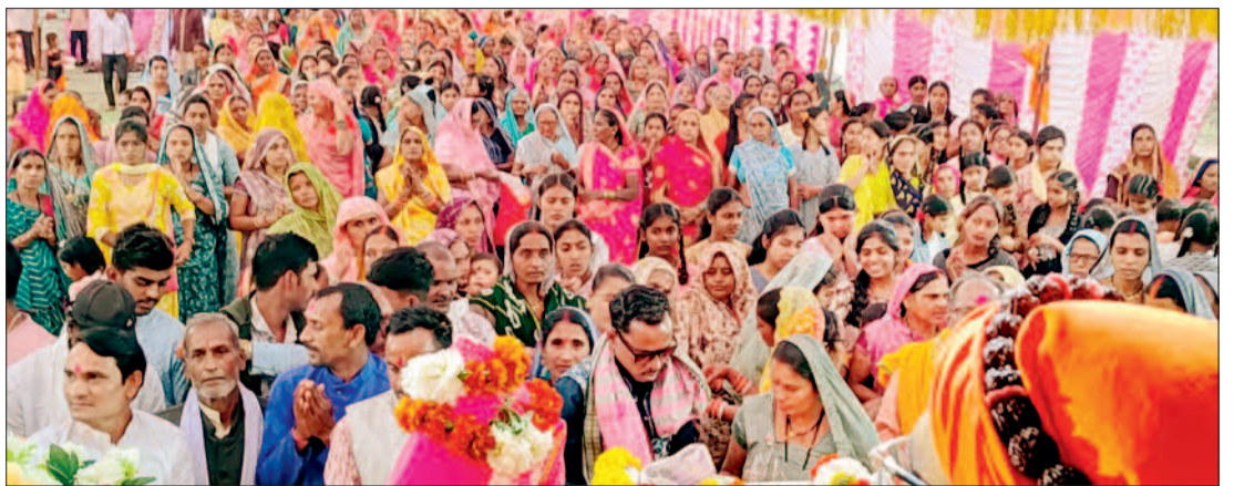
प्रह्लाद की भक्ति और सत्य के मार्ग का दिया संदेश