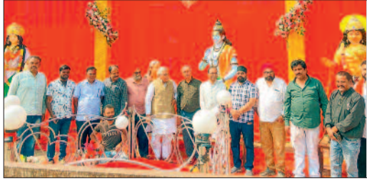
दुर्ग। लोक कला महोत्सव अछरा का दो दिवसीय आयोजन वार्ड 53-54 पोर्टियाकला स्थित दशहरा मैदान में किया जा रहा है। यह

लोककला हमारी सांस्कृतिक आत्मा, ऐसे आयोजन संस्कृति से जोड़ते हैं नई पीढ़ी को