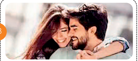
क्रश को करना इंप्रेस तो इस तरह से हों तैयार, देखकर सामने वाला होगा फिदा