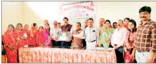
दुर्ग। महात्मा गांधी के पुण्य तिथि में राष्ट्रीय कुष्ठ उन्मूलन दिवस के अवसर पर जिला कुष्ठ सेवा समिति दुर्ग, सर्व समाज संगठन और पांच बिल्डिंग नागरिक मंच के संयुक्त तत्वावधान में कुष्ठ उन्मूलन जन जागरण अभियान का शुभारंभ किया गया। इसके तहत साप्ताहिक भवन पांच बिल्डिंग कुष्ठ उन्मूलन में समाज की भूमिका पर संगोष्ठी का आयोजन किया गया।